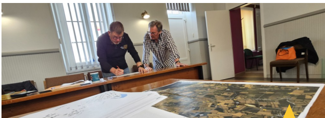
L'équipe des élus au travail sur les cartes et cadastre de la commune