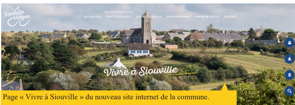
Page « Vivre à Siouville » du nouveau site internet de la commune.

Un travail de longue haleine a été entamé en 2023 autour du site internet de la commune. La décision a été prise de revoir l'ancien site, réalisé en 2015, tout en créant un second site pour le camping municipal de Clairefontaine. Le nouveau site de la commune a été mis en ligne le 5 février 2024 ( www.siouville-hague.fr ). Plus visuel, plus dynamique, il met en valeur le territoire et ses habitants. Il se veut aussi très pratique afin d'accéder aux informations des services publics dès la page d'accueil. Le camping aura son propre espace sur internet d'ici quelques mois, il proposera de la réservation des emplacements et mobil-home en ligne, ce qui n'existe pas actuellement.