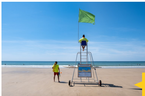
Les sauveteurs de l'ASES50 vont prendre la relève des sapeurs-pompiers l'été prochain.

La saison estivale se prépare toujours en hiver. Côté plage, la surveillance des baignades va connaître un changement important. Les sapeurs-pompiers ayant annoncé ne plus pouvoir assurer cette mission, communes concernées et pôle de proximité ont travaillé ensemble à pouvoir maintenir ce service important pour les habitants et les vacanciers. Après recherche active, réunions en préfecture et accord signés, c'est l'association ASES 50 de Cherbourg en Cotentin qui va se charger de mettre en place les sauveteurs sur les plages de Siouville-Hague, Le Rozel, Sciotot et Surtainville l'été prochain. La formation des jeunes sauveteurs est également assurée par cette association. Dans le Cotentin, les plages de Barneville, de Carteret et d'Urville vont être surveillées par la SNSM tandis que les plages de Portbail, Querqueville et Tournaville par des sauveteurs formés et faisant partie de l'ASES 50. A partir de 2025, cette structure sera remplacée par un comité départemental de sauvetage pour ces missions auprès des communes.