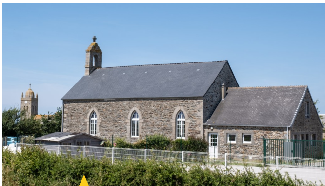
Le Temple pourrait abriter deux salles différentes d'ici avant la fin du mandat municipal actuel.

La salle du Temple fait l'objet d'une réflexion afin d'engager des travaux de réaménagement en 2025. Ses usages ne devraient pas être très différents qu'actuellement. Elle devrait pouvoir accueillir les réunions des associations, des concerts, des expositions, des banquets ou encore des réunions de famille... Elle sera sans doute plus grande sans toutefois réaliser une extension, il s'agirait plutôt de réaménagé également l'étage. Une étude technique va être menée dans ce sens. Le conseil municipal travaille sur ce dossier en réunissant régulièrement la commission travaux.