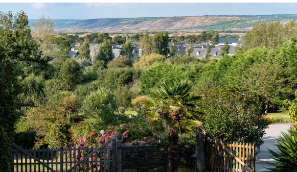
Le secteur de la Cour du parlement (sous Les Costils) est un des lieux d'implantation d'un aménagement de défense contre l'incendie.

Il se pourra également que des aménagements puissent voir le jour, au cas par cas, pour des besoins nouveaux d'urbanisation.